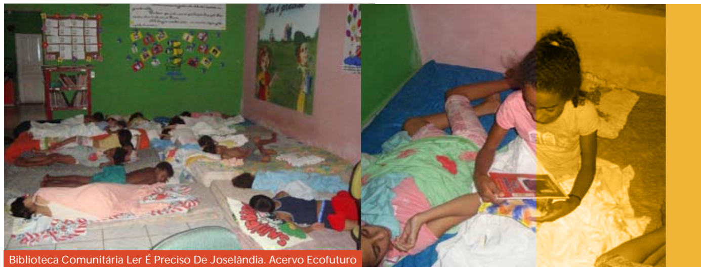
Biblioteca Comunitária Ler é Preciso De Joselândia.

CONFIAR NO TEXTO, HABITAR OS LIVROS: BOAS PRÁTICAS DE LEITURA EM BIBLIOTECAS COMUNITÁRIAS LER É PRECISO